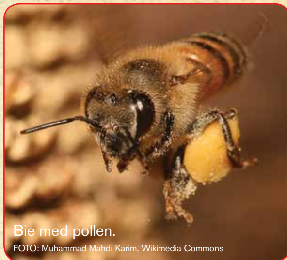
Bie med pollen.

HVORFOR: Biene trenger flere steder å bo. Ved å sette opp et biehus, gjør du en viktig jobb for å redde biene.